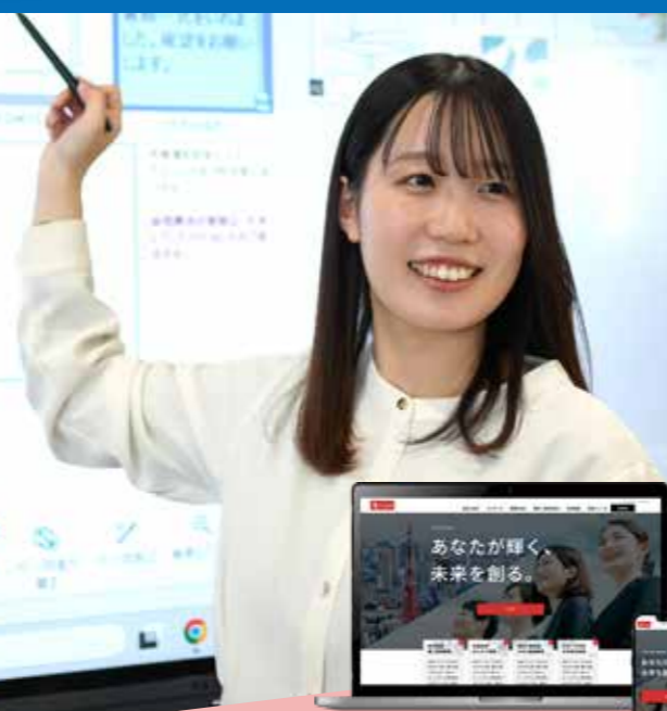
コンテンツ・ホームページ制作

DSS室(Document Solution Specialist)は、富士フイルムBIの複合機周辺ソフトウェアをはじめ、ネットワークやクラウドサービスに関する営業支援および導入後のサポートを担っています。 また、ホームページや各種コンテンツの制作・支援を行い、情報発信やブランディングの面からもお客様をサポートしています。お客様のDX推進をご支援するため、展示会・セミナー・体験会の企画・開催を行い、業務に役立つ最新ソリューションやAIを活用したサービスの紹介・提案を通じて新しい働き方をご提案しています。 さらに、社内およびお客様に向けた情報セキュリティ対策の提案も行い、安全・安心なICT環境づくりに貢献しています。